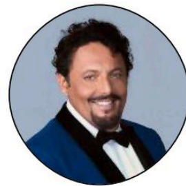
La comicità di Brignano In scena con 'Bello di mamma'

Continuano gli eventi del Ferrara Summer Festival in piazza Ariostea. Stasera (apertura cancelli alle 19, inizio spettacolo alle 21.30) tocca alla comicità di Enrico Brignano e al suo spettacolo dal titolo 'Bello di mamma'. Brignano è uno dei più amati comici e attori italiani, noto per la sua irresistibile verve romana, la capacità di raccontare con ironia i paradossi della vita quotidiana e una carriera che spazia dal teatro alla televisione, dal cinema alla regia.